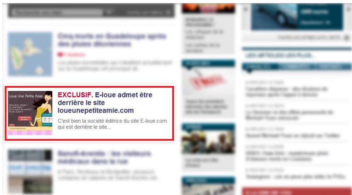
Une du site LeParisien.fr le 5 janvier 2010 suite à une interview d'Alexandre Woog

Un service de location de petite amie ne pouvait - et ne pourra jamais - être compatible avec e-loue et avec notre éthique.